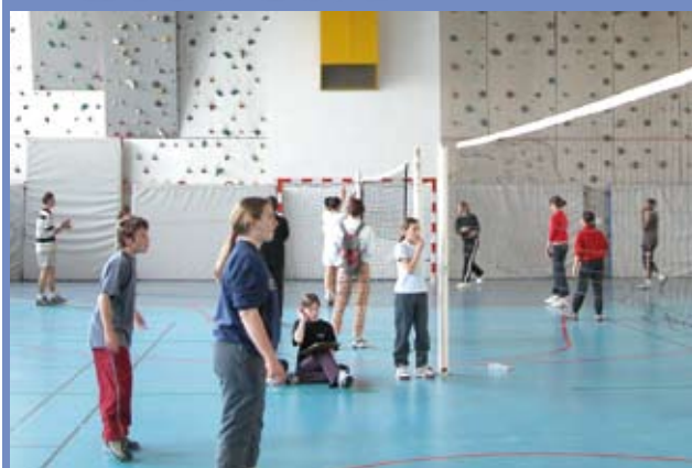
Entretien des équipements sportifs

communes). Au travers de ce constat, on comprend mieux la nécessité absolue de gérer avec la plus grande rigueur les dépenses de fonctionnement pour atteindre et maintenir le résultat dont nous sommes fiers : 2001-2009 : les taux d'imposition de la commune ont baissé de 1% alors même qu'ils ont augmenté de 9% en Isère et de 11% en France.