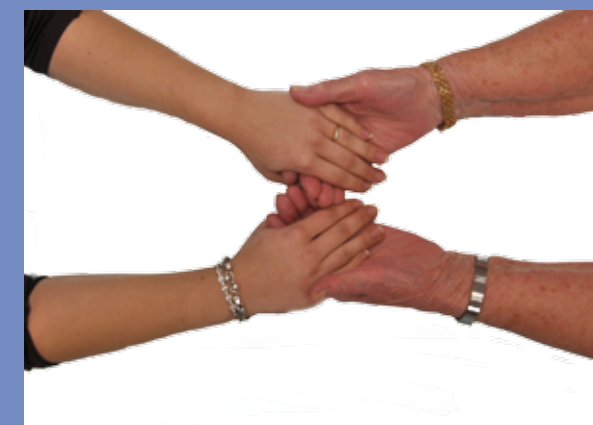
Augmentation des sommes allouées à la Solidarité