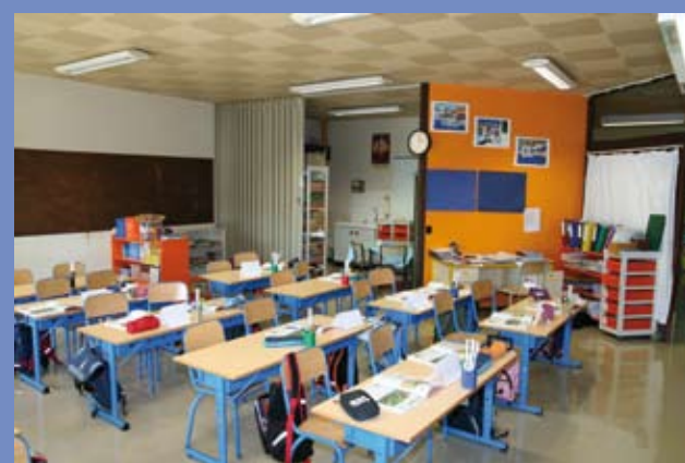
Entretien des 9 groupes scolaires